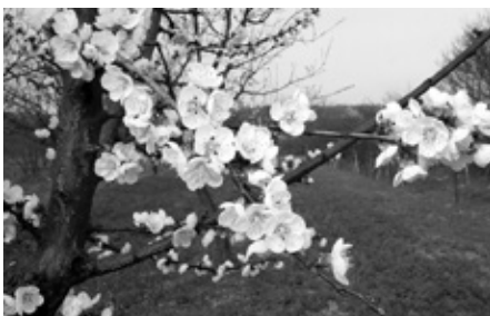
Rozkvetlé meruňky, typický kolorit jara ve Velkých Pavlovicích.

Jen několik příjemně teplých jarních dnů posledního březnového týdne stačilo k tomu, aby se meruňky, opět o něco dřív než je obvyklé, obalily závojem květů. Po mírné zimě, ve které včely každoročně strádají, zazněly koruny stromů jejich nedočkavým bzukotem. Konečně se dočkaly jara a první vydatné pastvy. A my se můžeme těšit na bohatou úrodu. Za příznivých podmínek budeme za 100 dní po květu sklízet pravý velkopavlovický poklad – voňavé a sladké meruňky.