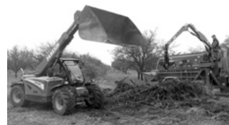
Úklid ořezaných větví a réví okolo vinic s následným štěpkováním.

Služby města se celoročně věnují údržbě veřejných prostranství ve Velkých Pavlovicích i jejich okolí. V měsíci dubnu, mimo mnohé další, zaměstnanci natřeli zábradlí u jezírka v lesoparku u zastávky ČD, odplevelili a doplnili mulčovací kůru pod zdobnými sakurami na ulici Orechová. S postupujícím jarem se zaměstnanci intenzivně věnují sečení travnatých ploch, likvidaci černých skládek a budování nové cesty v trati Ostrovce.