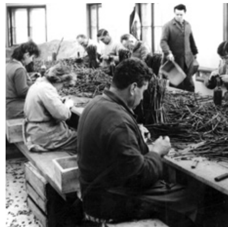
Historická fotografie - štěpkování.

Celá investice se potýkala s nedostatkem stavebního materiálu (cement, cihle, že- lezo, obkladačky). Proto se často měnila projektová dokumentace. V období výs- tavby v roce 1949 došlo k závažným změnám vlastnického charakteru. Minister- stvo zemědělství Praha 19. 4. 1949 vydalo nařízení, že v jednom místě nemohou působit dva podniky stejného výrobního zaměření a že se musí sloučit. Minister- stvo rozhodlo, že přejímajícím družstvem bude Vinopa – vinařsko - ovocnické druž- stvo a přejímaným Ovocnicko – vinařské družstvo Velké Pavlovice bez likvidace. Vzniklo družstvo VINOPA – vinařské družstvo Velké Pavlovice, které mělo 2 500 členů, majetek více než 50 mil. Kč, sklado- vací kapacity 260 vg a 109 zaměstnanců.