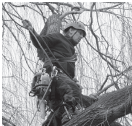
Pan Pláteník v bujarém porostu přerostlé vrby působí jako Spiderman. Nebezpečné povolání...

Velkopavlovický arborista pan Vítězslav Pláteník spolu se zaměstnanci služeb města využili příhodného předjarního počasí k odbornému ořezu vrby mezi domy Bří Mrštíků 14 a 16. Vrby jsou rychle rostoucí stromy s křehkým, měkkým a lehkým dřevem, které se velmi snadno vlivem větší zátěže láme. Důvodem zásahu je eliminace nebezpečí spojeného s velikostí stromu a blízkostí obytných domů. Vrby hluboký řez snášejí poměrně dobře a rychle vytvářejí nové koruny. Po tomto řezu dojde k obnově koruny, která však bude úměrná místu, kde vrba roste.