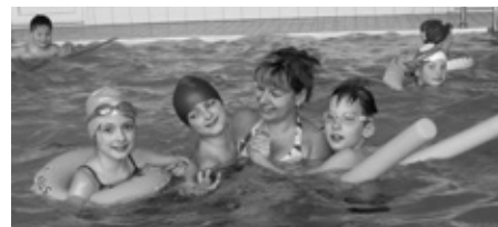
Plavání, skvělé zpestření výuky, školáci vždy s nadšením vítané. Na bazéně v Hustopečích se vždy cítí „jako ryby ve vodě“ :-)