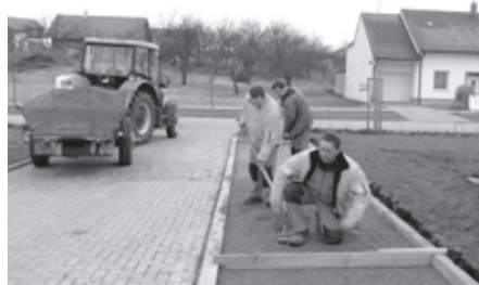
Služby města splnily přání seniorů, u penzionu vzniklo parkoviště.

Stavební skupina služeb města vybudovala nové parkoviště s podélným stáním u penzionu pro seniory. Právě zde bylo parkování palčivým problémem, který obyvatele penzionu trápil. Možnost parkování uvítali jak obyvatelé penzionu, tak jejich příbuzní a známí. Zaměstnanci služeb osadili obrubníky a bylo navedeno kamenivo na spodní podkladové vrstvy kufru. Dalšími kroky bylo položení betonové dlažby, dosypání zeminy k obrubníkům, srovnání nerovností v záhonech a zatravněných plochách, které se časem vytvořily sesedáním půdy.