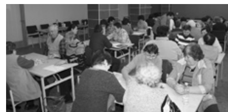
Litý boj! Ve Člověče nezlob se ani vlídný senior nezná bratra!