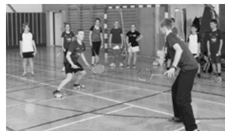
Soustředění badmintonového dorostu. Nejdříve trénink s profíkem, potom relaxace, avšak opět aktivní, v bazénu.