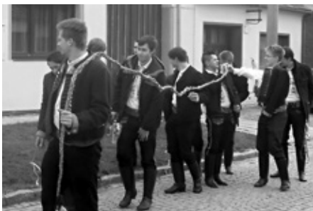
Velikonoční pondělí je zasvěceno obchůzce děvčat a šlahání...

i těch menších. A tak se i u nás našly mezi stárkami a sklepníci takové, které nevěří na pověsti a tradice a netouží být po celý rok zdravé a svěží.