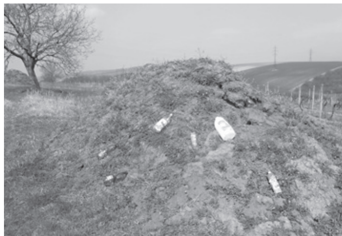
Nepěkný pohled... a to máme ve Velkých Pavlovicích 3x týdně otevřený sběrný dvůr.