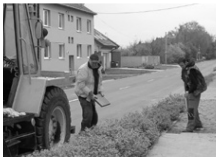
Zahájení generální opravy chodníku na ulici Nádražní.

Rekonstrukce chodníků v programu Mobility pokročila do další etapy. V měsíci dubnu 2016 přišel na řadu chodník na ulici Nádražní. Část stavebních prací provedli zaměstnanci Služeb města Velké Pavlovice a část zaměstnanci stavební firmy Strabag, a.s.