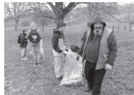
Ruku k dílu při velkém jarním úklidu dali i členové Lesní ligy moudrosti Kmene Vlků.

Všem, kteří se dobrovolně přidali a pomohli tak „příchodu jara“ a ke zkrášlení našeho okolí, patří poděkování.