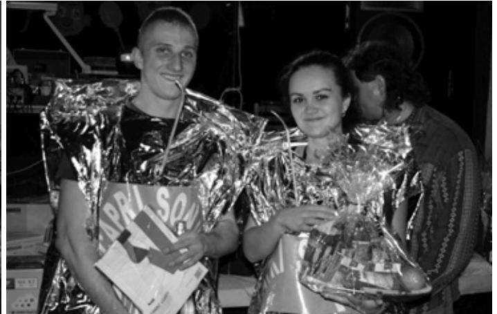
Limonády Capri Sonne