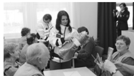
Členové místního Klubu důchodců si odnesli z přednášky Policie ČR nejen nové a důležité informace, ale také reflexní tašku.