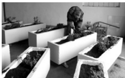
Květiny, krásná a příjemná ozdoba veřejných prostranství města.

Velké betonové truhlíky, které v uplynulých letech krášlily autobusové nádraží a prostory před radnicí, prošli začátkem dubna 2016 údržbou. Původní přerostlé keře byly vysazeny na vytipovaných místech ve městě a okolí a do čerstvě natřených truhlíků zasadili zaměstnanci služeb města mladé rostliny. Kombinace kvetoucích i stálezelených rostlin vhodných k výsadbě do nádob tak opět zdobí autobusové nádraží i náměstí před radnicí.