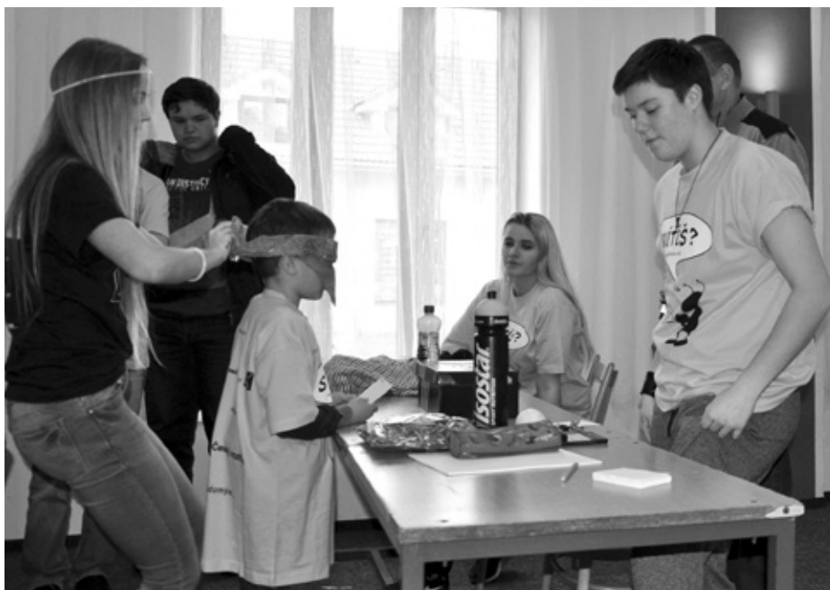
Apríles, letos se Světluškou, patřil i dětem. Organizátoři z řad studentů druhého ročníku a sexty si pro ně připravili řadu soutěží a sladkých cen.