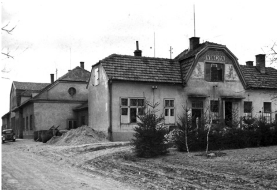
Budova Vinopy – Ostrovec, pohled ze severu.

V roce 1938 Vinopa vybuodovala pěstitel- skou a živnostenskou pálenici a v násle- dujícím roce bylo při nadúrodě vypáleno 10 vg padaných merunek. Velmi populár- ní a oblíbený mezi konzumenty byl likér „Velkopavlovický Svéráz“, který se vyrá- běl zvláštní technologií z meruňkového destilátu. V období protektorátu byla vy- budována sodovkárna, v objektu Ostrovec zřízena vinárna, v Rajhradě byly pronaja- ty dva velké sklepy od místního kláštera a vysazeny vinice. V Bořeticích byl vybu- dován sklep a lisovací kapacita.