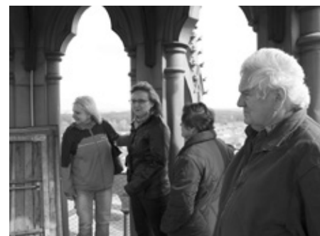
Velkopavlovičtí seniory pokořili 188 schodů věže kostela v Poštorné. Odměnou jim byl nádherný výhled.