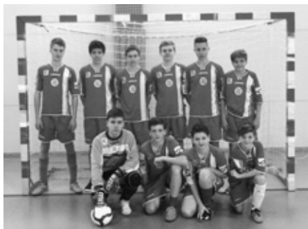
Futsalový tým ZŠ Velké Pavlovice boduje, probojoval se až do finále Divize Moravy.