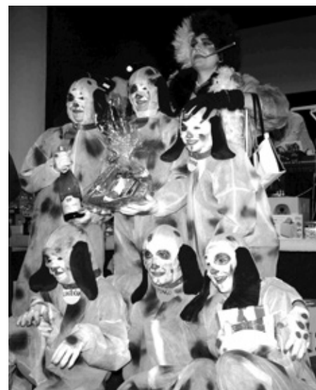
101 dalmatinů s Cruellou