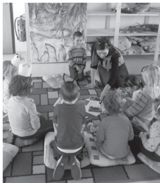
Ekocentrum Trkmanka navštívily také děti z velkopavlovické mateřské školy. Lektorky si pro ně připravily program s názvem „Na návštěvě u Ferdý“.

O činnosti Ekocentra Trkmanka i dalších připravovaných akcích se můžete informovat telefonicky na čísle 519 325 313,