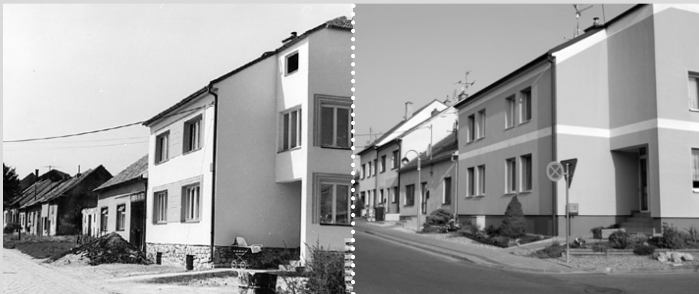
Ulice Ořechová, rohový dům rodiny Dostoupilovy.

SOUTĚŽNÍ FOTOGRAFIE - už poznáváte toto místo :-)