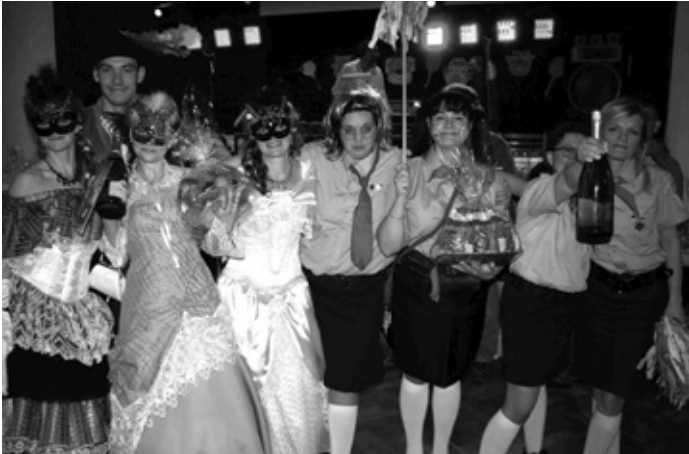
Oceněné masky Šibřinek roku 2016 – Komtesy a Pionýrky