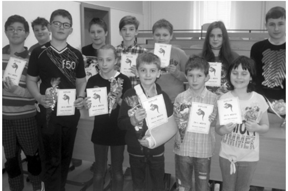
Nejúspěšnější řešitelé Matematického klokana na základní škole.