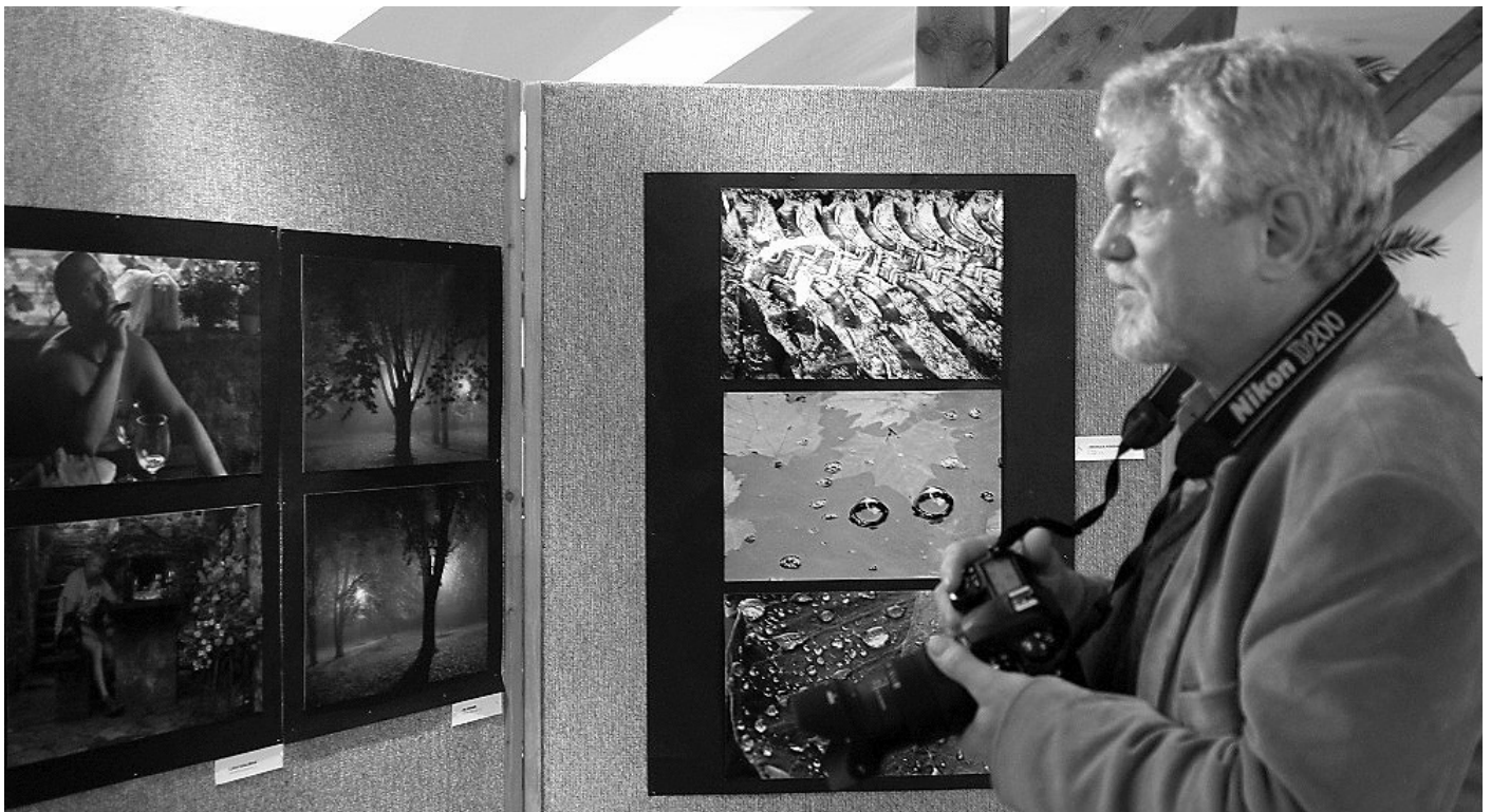
Vernisáž výstavy fotografií Slovenské pohledy 2015.

Slovenské pohledy 2015 se jmenovala výstava, která byla v pátek 18. března v podvečer zahájena slavnostní vernisáží ve výstavním sále Městského úřadu Velké Pavlovice. Více než 50 velkoformátových černobílých i barevných fotografií představilo výběr z prací Fotoklubu při Záhorském osvětovém středisku v Senici, která je partnerským městem Pavlovic.