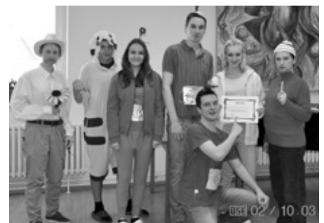
Studenti gymnázia se v rámci „speciálního dne“ oblékli do kostýmů knižních, filmových a seriálových hrdinů