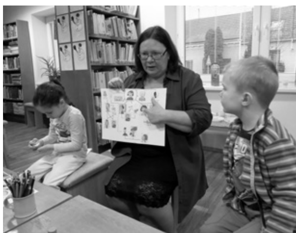
Pohádkové odpoledne v knihovně pro nejmenší nebylo jen o knížkách, čtení a tajuplných příbězích, ale také o úkolech a tvoření.

Děti, které chodí do školy a do mateřské školky, jejich maminky, babičky, tatínkové i malí bráškové a sestřičky. Bylo nás nakonec v knihovně tolik, že jsme se k připraveným stolečkům málem nevešli. Pohádkových úkolů bylo ovšem připraveno dostatek, stačilo si jenom vybrat: skládky? hádanky? omalovánky? puzzles? doplňovačky? výtvarné hádanky?